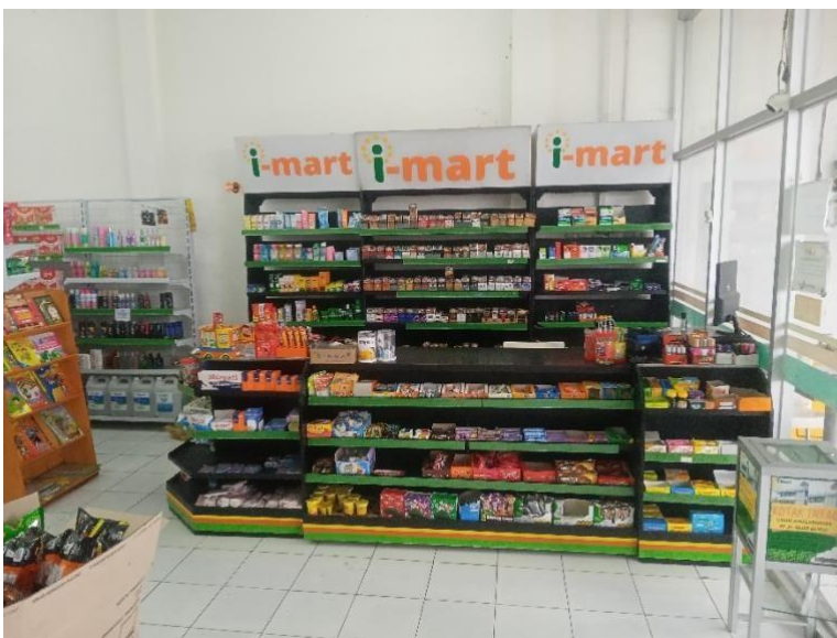
gambar 3.2 bagian kasir