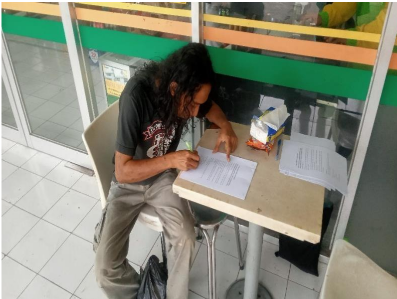
gambar 3.5 Responden mengisi kuisisioner