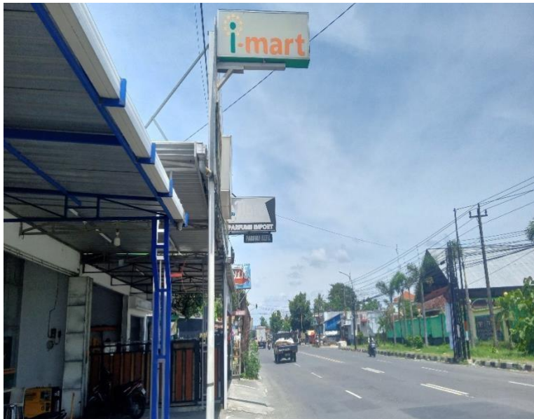
gambar 3.3 bagian depan toko tampak jalan