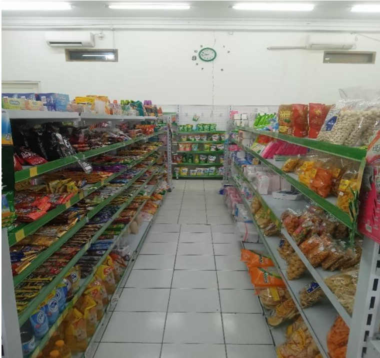
gambar 3.1 bagian dalam toko