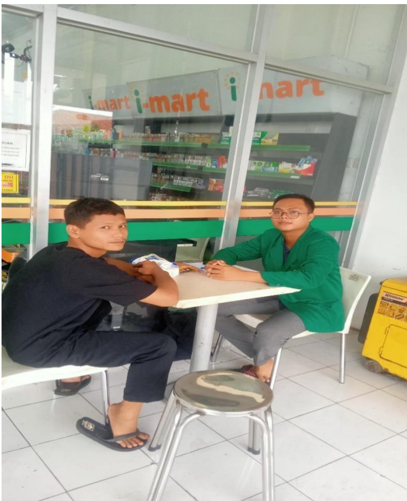
gambar 3.6 peneliti mewawancarai kepala toko